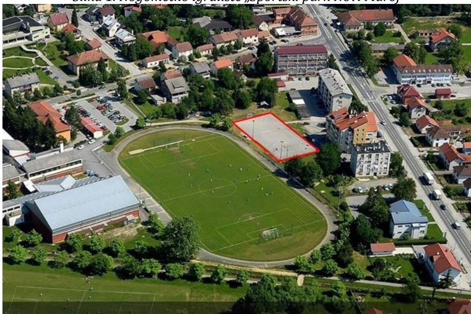
Slika 1. Nogometno igralište „Športski park Novi Marof“

Grad Novi Marof nije ostvarivao rashode po osnovi upravljanja i raspolaganja nogometnim igralištem. Rashodi za održavanje i drugi rashodi poslovanja odnose se na režijske troškove struje, vode i energenta za grijanje nastale korištenjem nogometnog igrališta. Režijski troškovi i troškovi održavanja podmiruju se na temelju računa dobavljača. Sve rashode snosi Nogometni klub kome je nogometno igralište dano na upravljanje.